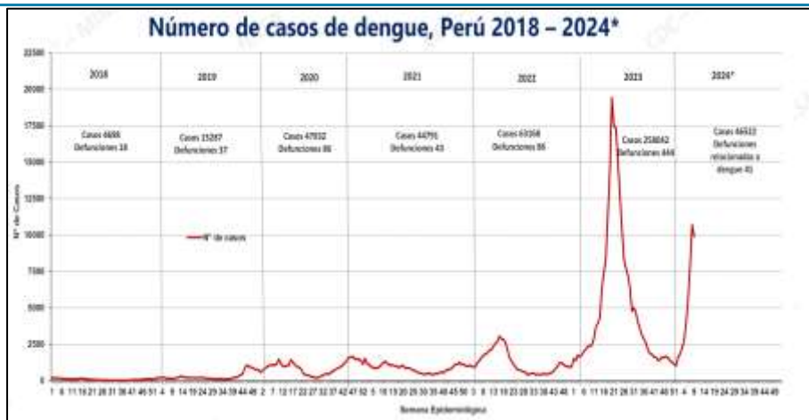
Centro Nacional de Epidemiología, Prevención y Control de Enfermedades (2024) - Sala de situación de salud de Dengue Perú a la SE 09 - 2024

Así mismo, es importante destacar que, durante los años 2020 y 2021, se observó un incremento en la carga de enfermedad debido al SARS-CoV-1 (COVID-19). Este virus desencadenó una pandemia que exacerbó las limitaciones de un sistema de salud ya desbordado por la demanda, saturando los servicios sanitarios. Este contexto resultó en un aumento significativo tanto en la mortalidad como en las complicaciones a largo plazo asociadas con la enfermedad. Hasta la fecha, se han registrado un total de 4,576,393 casos confirmados acumulados y 220,990 defunciones acumuladas atribuidas a COVID-19.