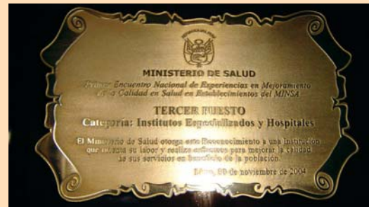
Aliciente. Premio para todo el personal de la Consulta Externa.

El reordenamiento de la atención en Consulta Externa, la identificación y simplificación de los procesos y el compromiso de los profesionales asignados en la atención ambulatoria están repercutiendo favorablemente en la disminución del tiempo de es-