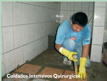
Cuidados Intensivos Quirúrgicos