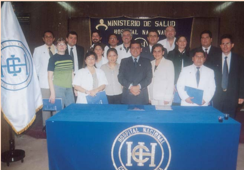
Al fin nombrados. Algunos trabajaron como contratados por más de 10 años. Los nuevos médicos nombrados en compañía del Director General.