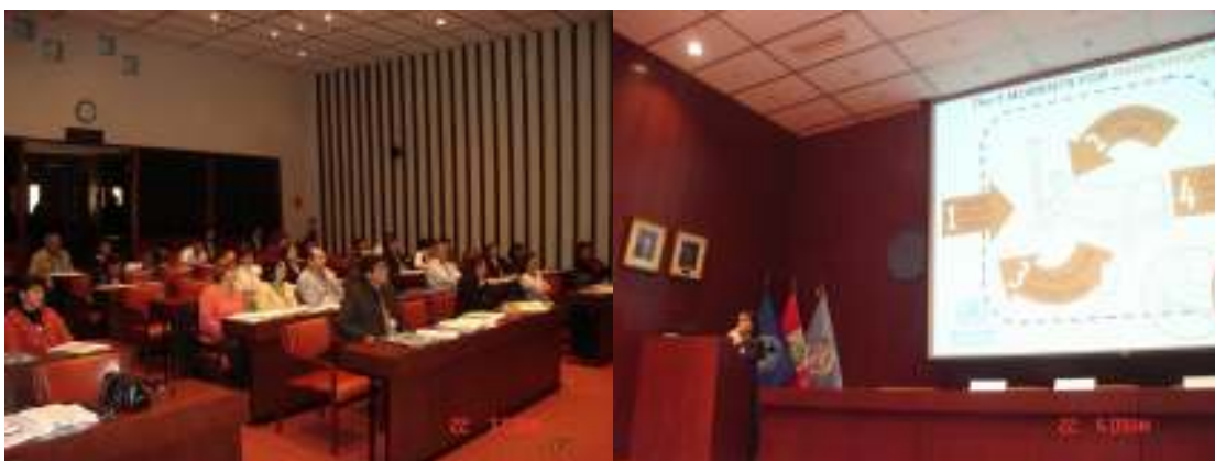
Foto 1.-Participantes de los hospitales piloto de Lima. Foto 2.-, expone Lic. Rojas.