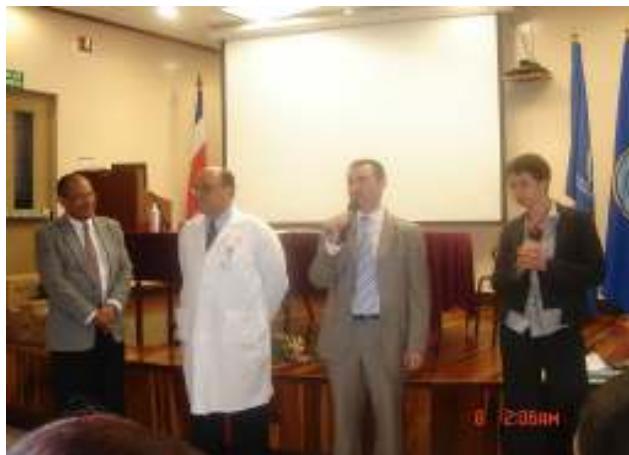
Organizadores del taller en Costa Rica

Una comisión de nuestro país es designada para participar en el taller “Una Atención Limpia es una Atención más Segura” realizada en la ciudad de San José en Costa Rica, del 28 al 30 de Mayo de 2008, en la cual se presentó la experiencia de implementación de la “Estrategia Multimodal de Higiene de Manos” del Hospital de Niños de la mencionada ciudad, la misma que fuera monitoreada durante un año como centro piloto de las Américas en la aplicación de la citada estrategia.