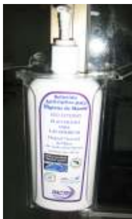
Dispensador Solución alcohólica

La solución alcohólica que se utilizará, será la propuesta por el Equipo responsable; de la Dirección General de Medicamentos, Insumos y Drogas y del Instituto Nacional de Salud, encargados de verificar la idoneidad de la solución y la preparación de la misma, lo que según lo establecido, será coordinado con los expertos que conducen el Proyecto 1er Reto Mundial en Pro de la Seguridad del Paciente.