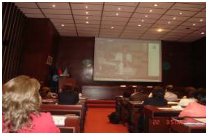
Foto 3.-Vista posterior de auditorio.