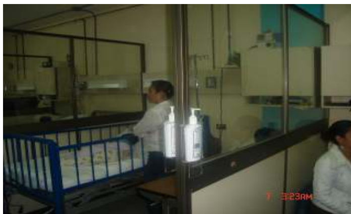
Ubicación del Dispensador de Solución alcohólica