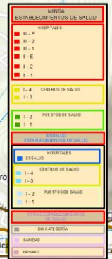
ESTABLECIMIENTOS DE SALUD EN UN RADIO DE 2 KM