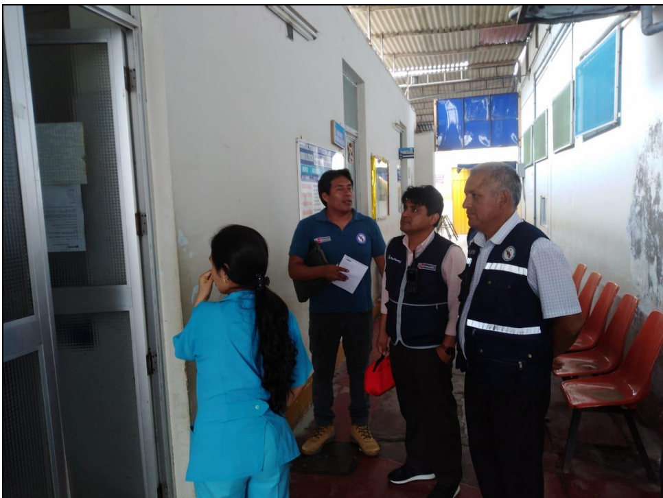
EQUIPO TÉCNICO DIGERD REALIZANDO LA EVALUACIÓN DE DAÑOS Y ANÁLISIS DE NECESIDADES