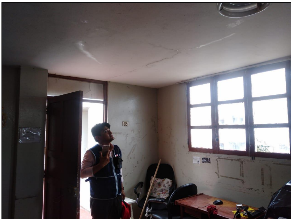
EQUIPO TÉCNICO DIGERD REALIZANDO LA EVALUACIÓN DE DAÑOS Y ANÁLISIS DE NECESIDADES

“Año de la Lucha contra la Corrupción la Impunidad”