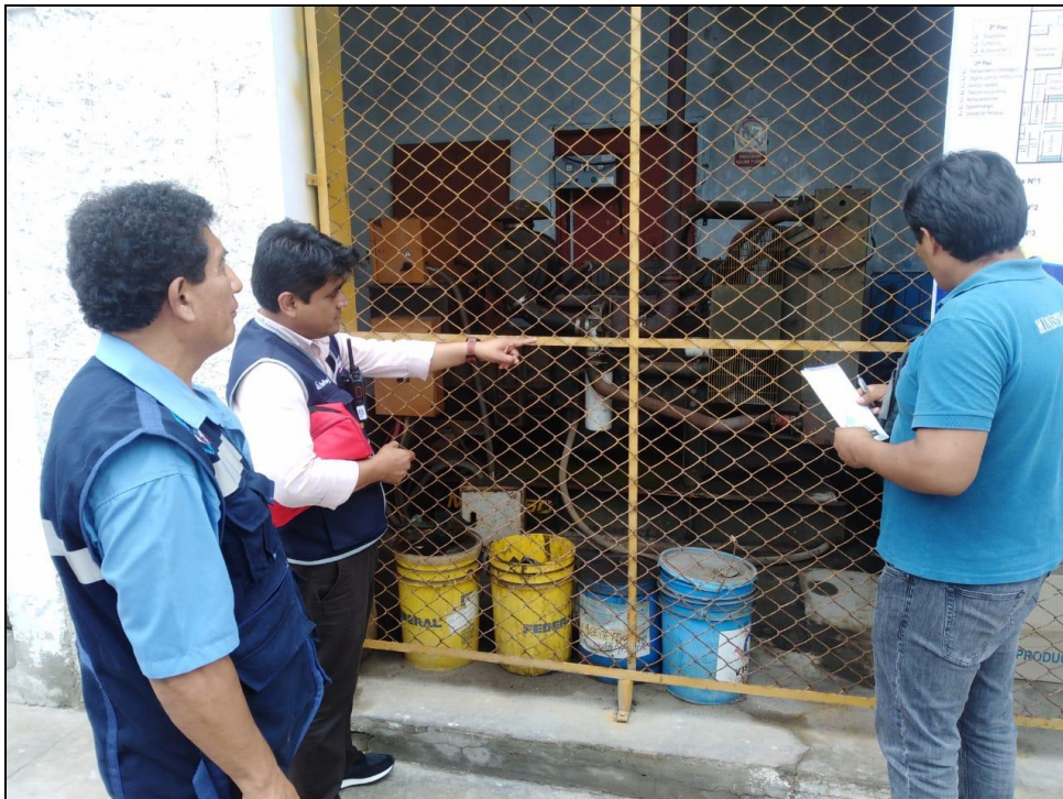
EQUIPO TÉCNICO DIGERD REALIZANDO LA EVALUACIÓN DE DAÑOS Y ANÁLISIS DE NECESIDADES