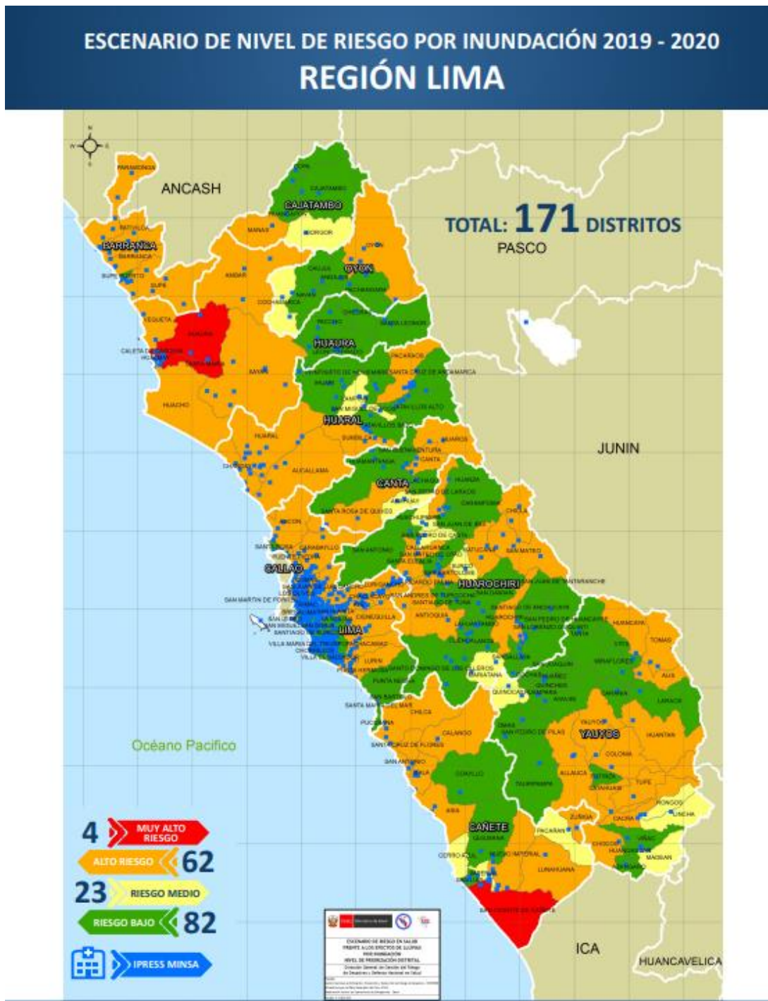
GRAFICO N°02: Escenario de nivel de riesgo por inundación 2019-2020

“Decenio de la Igualdad de Oportunidades para Mujeres y Hombres” “Año del Diálogo y la Reconciliación Nacional”