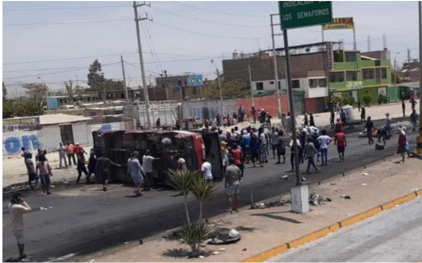
VEHÍCULO OBSTACULIZANDO EL TRÁNSITO EN EL SECTOR BARRIO CHINO – DISTRITO SALAS GUADALUPE