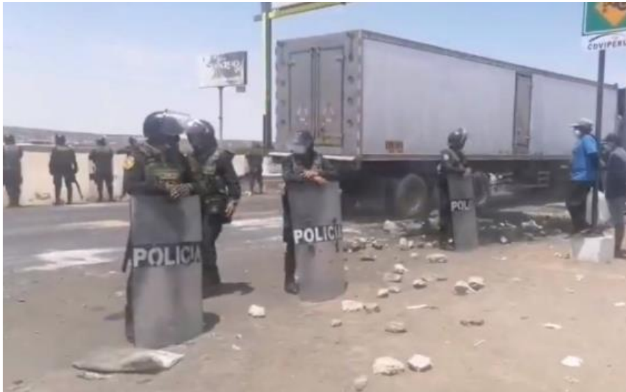
LLEGADA DE REFUERZOS PNP AL DISTRITO DE SALAS GUADALUPE