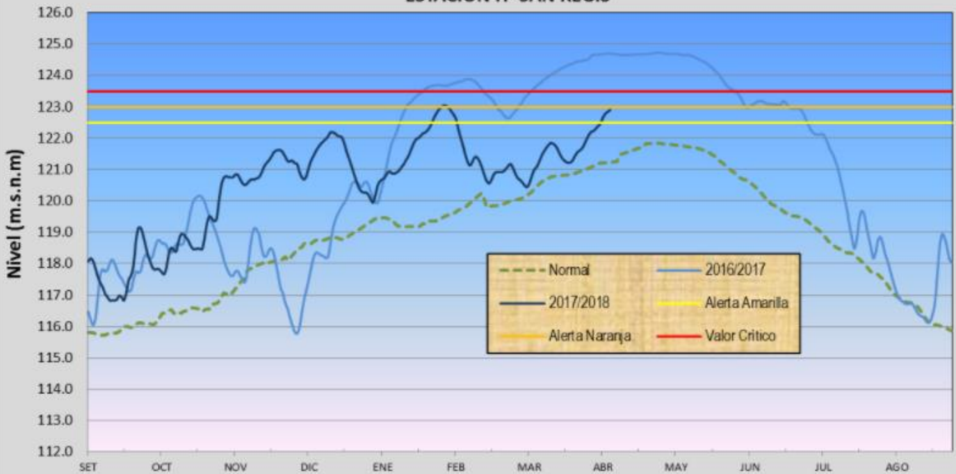
HIDROGRAMA DE NIVELES DE AGUA DEL RÍO MARAÑÓN ESTACIÓN H- SAN REGIS

De acuerdo al último reporte hidrológico de la Dirección Zonal 8 SENAMHI (Loreto), el río Marañón registró en la estación de control H-San San Regis una cota de 122.90 msnm, encontrándose a 1.66 m por encima de su nivel normal. La tendencia para los próximos días será ascendente; asimismo, el río Marañón entraría dentro de 24 horas en Alerta Hidrológica Naranja. Dicha situación provocará inundaciones en diferentes zonas de la provincia de Loreto, como las localidades de San Regis, Parinari y Urarinas.