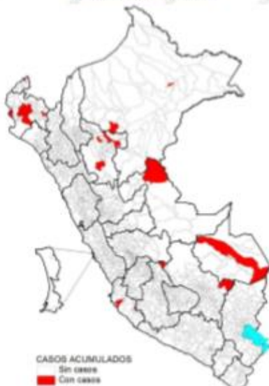
Casos acumulados 2018*

Desde la SE 1 a la SE 11 del 2018, 27 distritos reportaron al menos un caso de chikungunya, concentrados el 91% de estos en los departamentos de Piura, San Martín, Ucayali, Tumbes y Loreto.