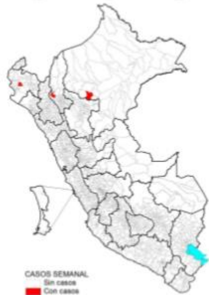
Casos en la SE 11 - 2018

En la SE 11 son 6 distritos distribuidos en 5 provincias de 4 departamentos que registran casos de zika.