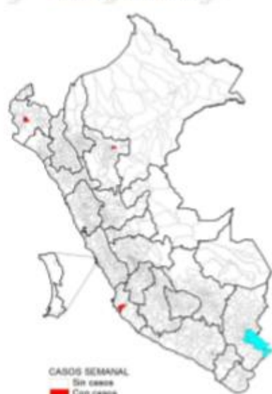
Casos en la SE 11 - 2018

En la SE 11 se presentaron 2 casos de chikungunya, en 1 distritos, 1 provincia en un departamento.