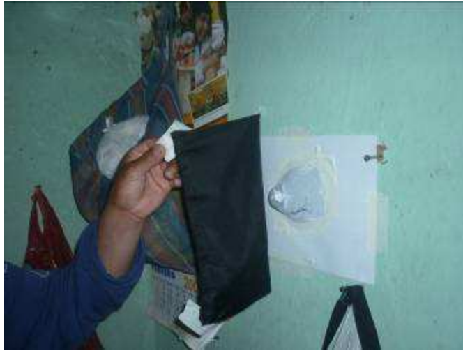
Figura No 03: Colocando los Zancudos en la localidad de Chinobamba.