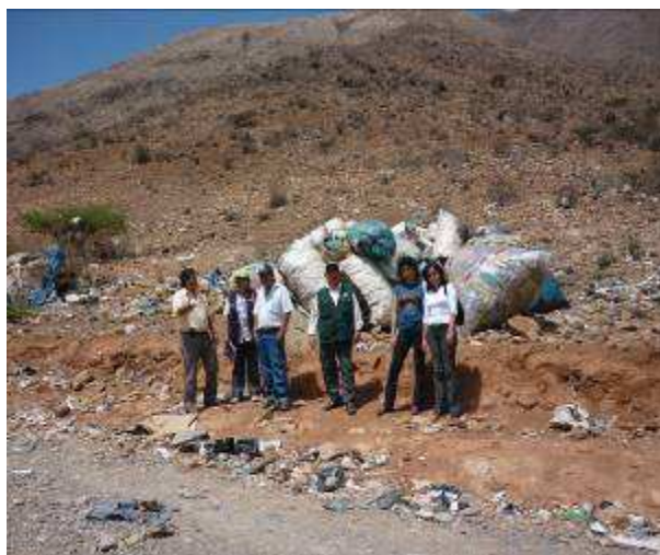
Fotog. Todos los rsh que no son tratados adecuadamente van a terminar al botadero de Marabamba, donde el personal de salud realiza la vigilancia adecuada.