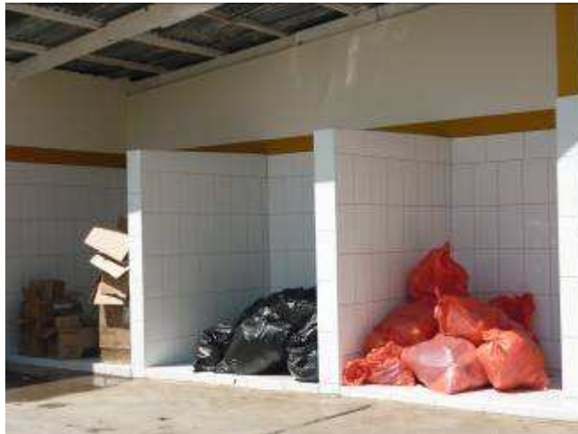
Fotog. Hospital Hermilio Valdizan Medrano - Huànuco