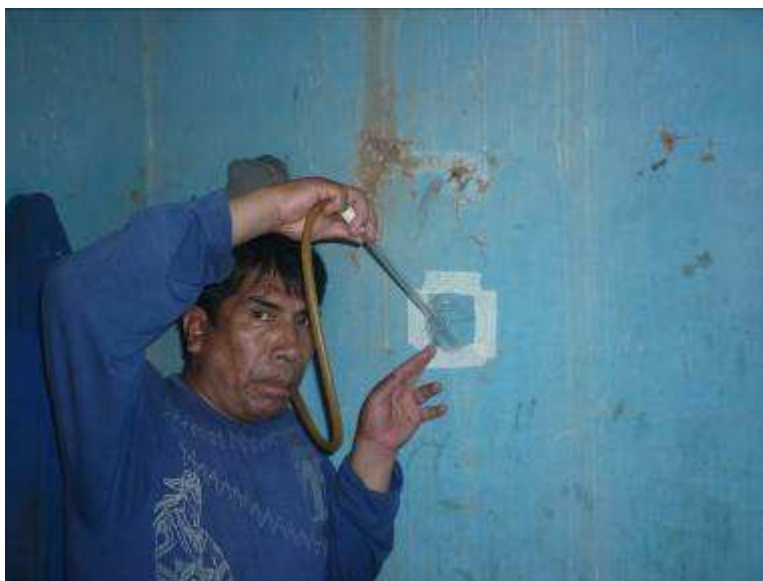
Figura No 01: Metaxenico Colocando los zancudos para realizar la prueba de residualidad en la localidad de Chinobamba.