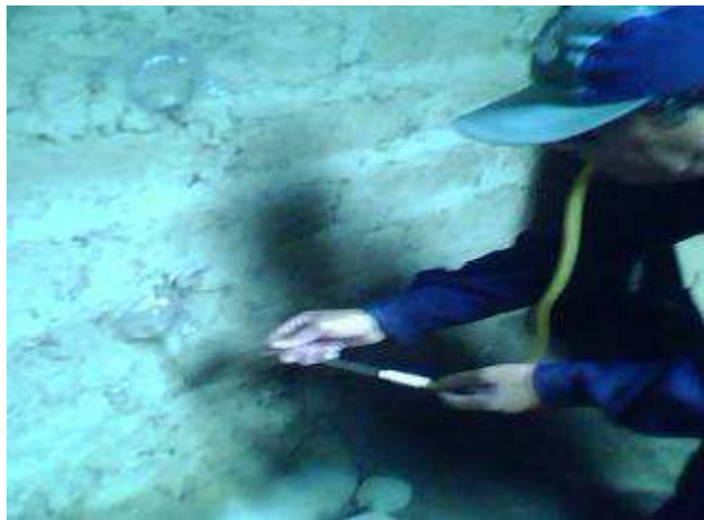
Figura No 04: Colocando los Zancudos en la localidad de Chinobamba