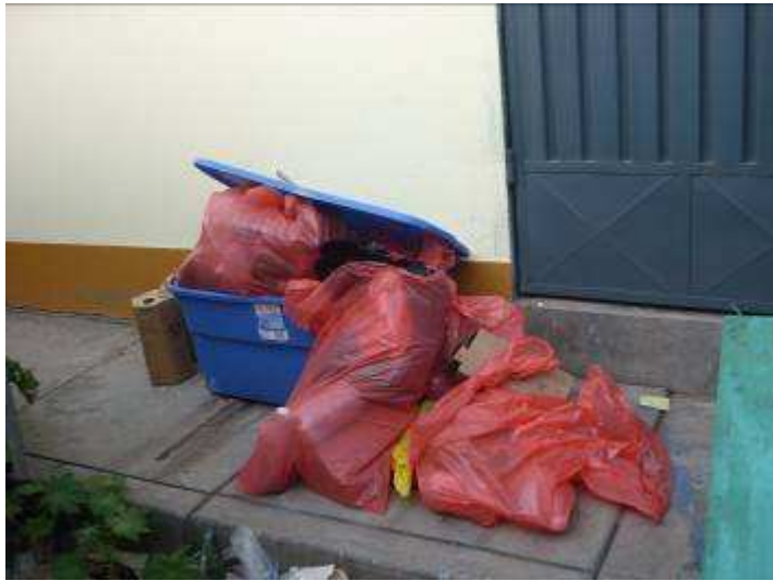
Fotog. Almacenamiento final de residuos sólidos hospitalarios biocontaminados para su tratamiento en el HRHVM.