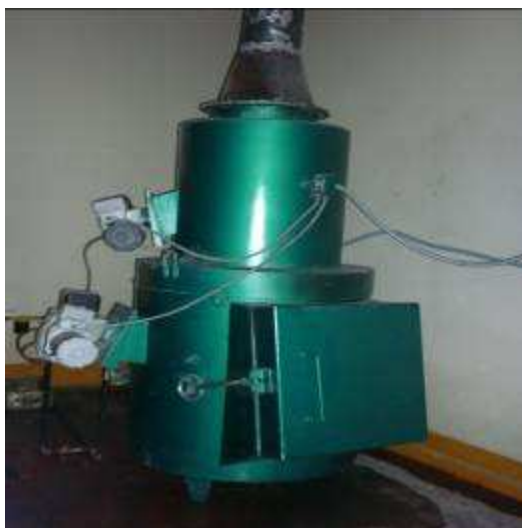
Fotog. Quemador el HRHMV