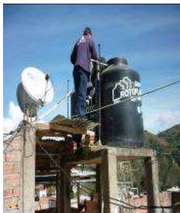
Tanque Hotel CALI