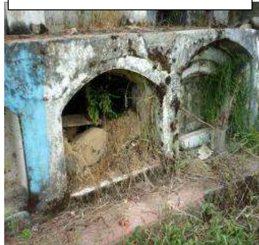
Contaminación ambiental existente