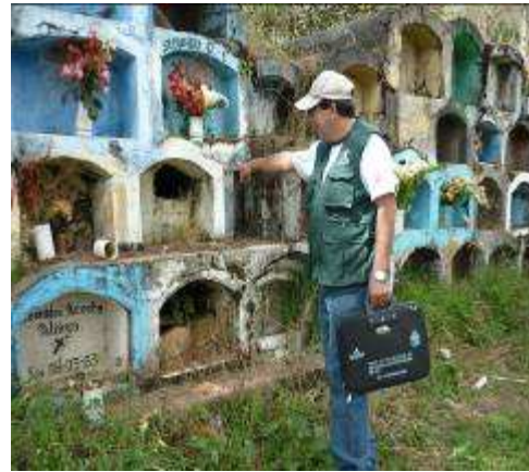
Estado de los Nichos