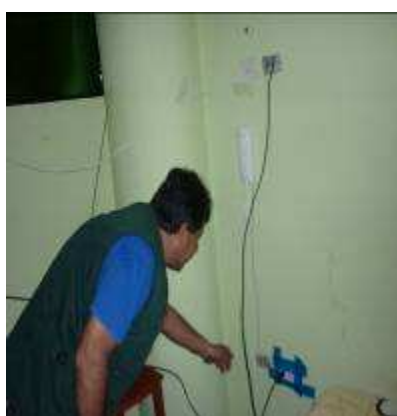
HOTEL LOS ANGELES