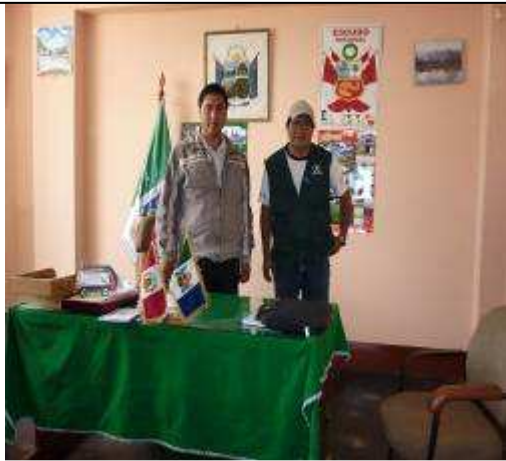
Coordinación con el Alcalde de Chaglla para mejorar el cementerio