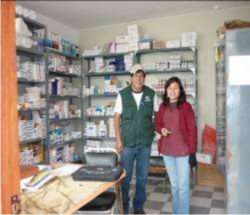
Entrevista con la Gerente CLAS dCLASDS