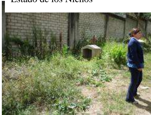
Jardines en total descuido