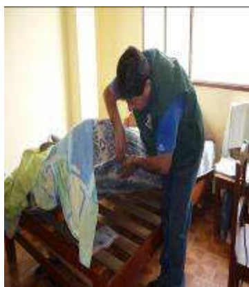
Hotel JOSE ANTONIO