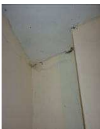
HOSPEDAJE MEDIA LUNA