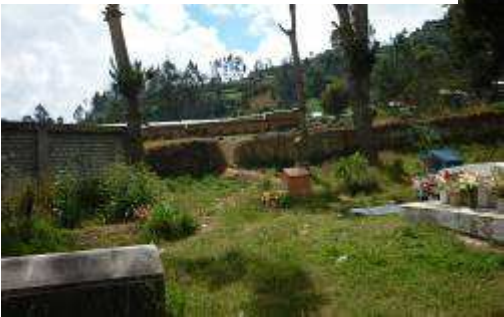
Cercos perimétricos en mal estado