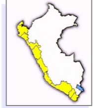
Porcentajes a Nivel Nacional