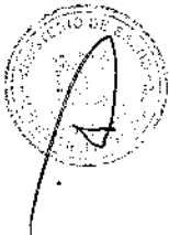
MIDORI DE HABICH ROSPIHLIDSI Ministra de Salud