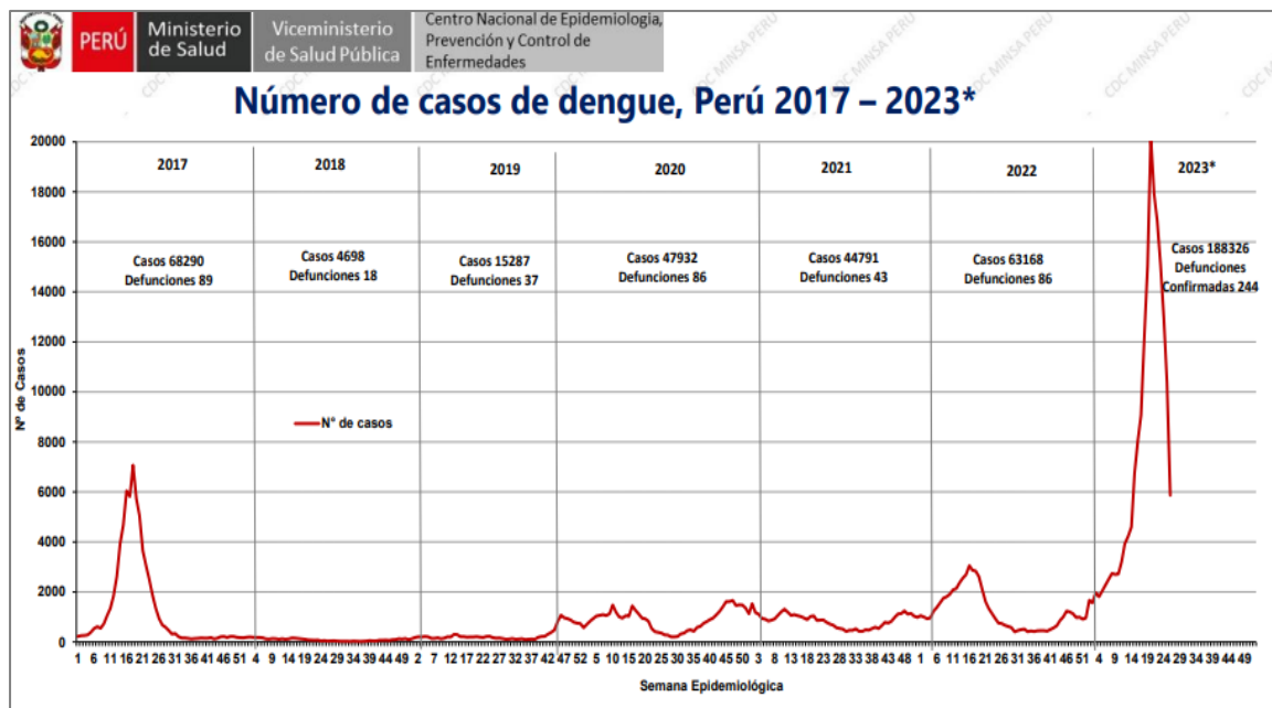
GRAFICO N°2 NUMERO DE CASOS DE DENGUE 2017-2023